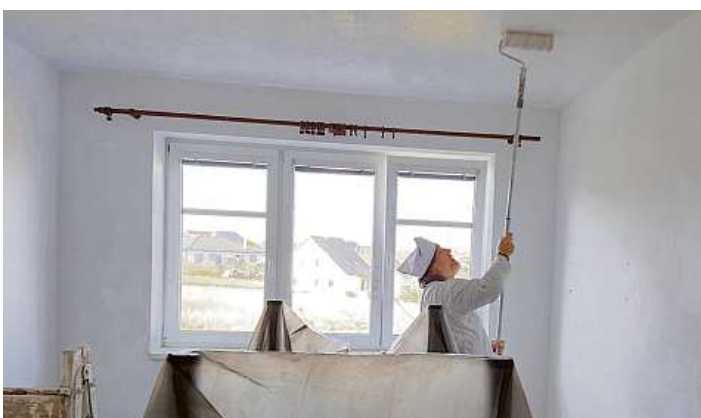
Mistři z cechu malířského za pomoci učňů vymalovali během necelých dvou dnů všechny dětské pokoje a společné prostory domova

Tipy a snímky do rubriky zašlete na pozitivnizpravy@lidovky.cz